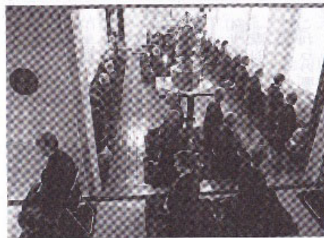
多くの人びとが修行に参加する

ています。禅川寺に居住している僧侶は、現在のところ葬儀や法事などの要請などが定期的にあるわけではないので、寺院を維持すること、そして修行に來る人びとの修行をより良いものにするための補佐なども役割の一つです。それら外部から修行に來る人たちは、禅川寺の活動のために喜んで寄進