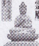
長野県 特別院様上納